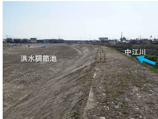
④中江川：調節池整備（完成）