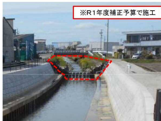
③水場川：河道整備（西流橋付近）