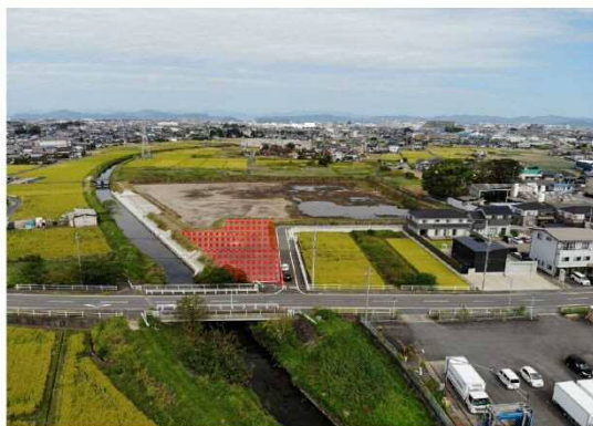
⑤青木川：第3号調節池整備